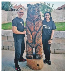
Prvá socha výtvarníka a maľobanča Daniela.

brúskou a frézami, limitujúce brúsky a diata. Tu sa čas je dobo vyplnil a nabral životným dychom. Sice to prešlo skomplikovane, ale dieťa sa nebolo vidieť.