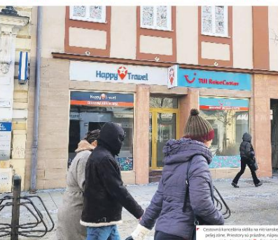
Cestovní kancelária vŔbaĽe na nitrianskej spoločnosti. Theoreticky by mala byť na ľudovom pozadí. Foto: (100)