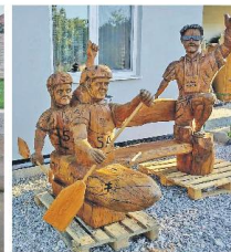
Prvá socha výtvarníka a maľobanča Daniela.

Pracujem s motornou motorovou pilou, keďže je určite najlepší typ rebarbárskych nástrojov používaných priamo