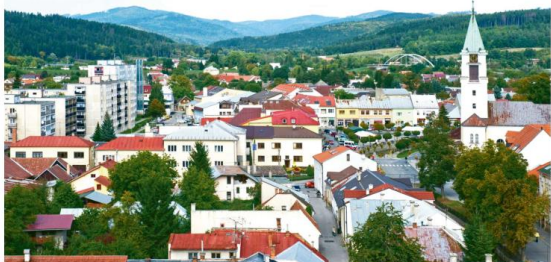
Bytčania na jarný rozhodnutí, či bude Miroslav Minárik alebo po parkyrist primátorom takmer za tisícovku mesa.

Výsledky prieskumu favorizujú dvoch kandidátov.