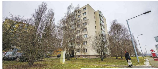
Sídlište na Koniarkovej ulici už spravuje, chýba tam však zmeny.

Domáci z Koniarekovej na zmeny zatiaľ iba čakajú.